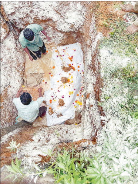
मृत बेबी एलीफेंट का कफन दफन करते हुए।