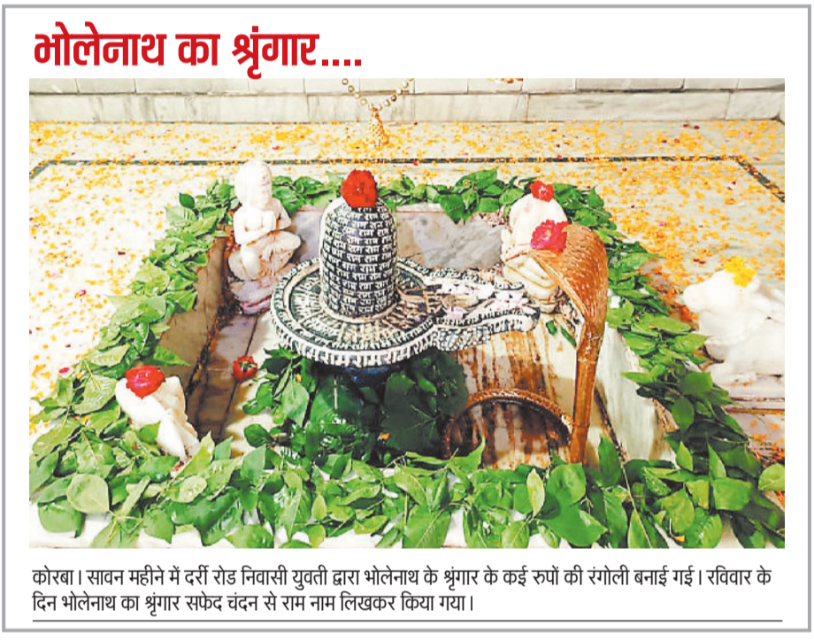
कोरबा। सावन महीने में दर्शन रोड निवासी युवती द्वारा भोलेनाथ के श्रृंगार के कई रुपों की रंगोली बनाई गई। रविवार के दिन भोलेनाथ का श्रृंगार सफेद चंदन से राम नाम लिखकर किया गया।