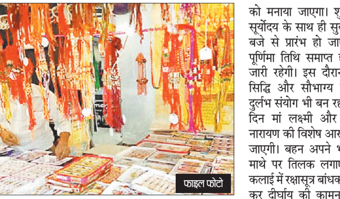
2.12 बजे शुरू होगी, नौ अगस्त की दोपहर 1.52 बजे समाप्त होगी। ज्योतिषाचार्य के अनुसार

हरिभूमि न्यूज ►► कोरबा भाई-बहन के अटूट प्रेम का प्रतीक रक्षाबंधन पर्व 9 अगस्त को लगभग सात घंटे बहने अपने भाई की कलाई में रेशम के धागे बांध सकेंगे। इस बार रक्षाबंधन पर्व पर सर्वाथ सिद्धि और सौभाग्य योग का विशेष संयोग बन रहा है, जो अत्यंत शुभ और फलदायी बना रहा है। पर्व को लेकर भाई और बहनों में खासा उत्साह देखने को मिल रहा है। सावन माह की पूर्णिमा तिथि को रक्षाबंधन पर्व मनाया जाता है। पूर्णिमा तिथि आठ अगस्त से