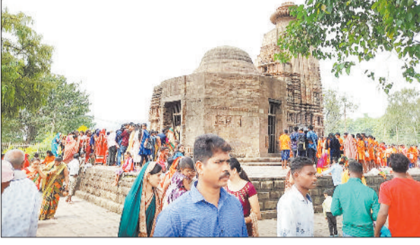
सावन महीने में शिव मंदिरों में जलाभिषेक करने पहुंची श्रद्धालुओं की भीड़।

कनकेश्वरधाम से लेकर पाली शिव मंदिर तक लगा भक्तों का मेला