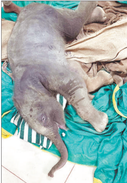
मृत बेबी एलीफेंट का शव।